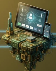
Social & Mobile